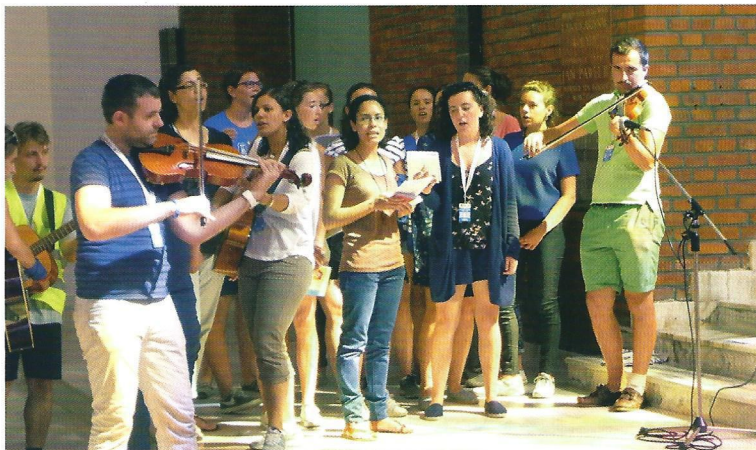
Chanteurs et instrumentistes de notre groupe animent la messe.