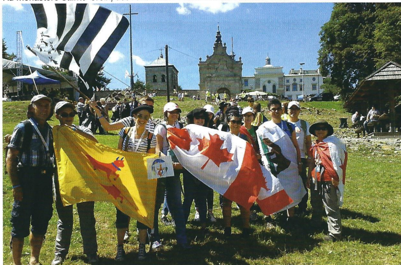
Au monastère Sainte-Croix, des rencontres internationales des JMJistes !

De retour à Stalowa Wola : prière du chapelet avec les jeunes volontaires polonais et les fa-