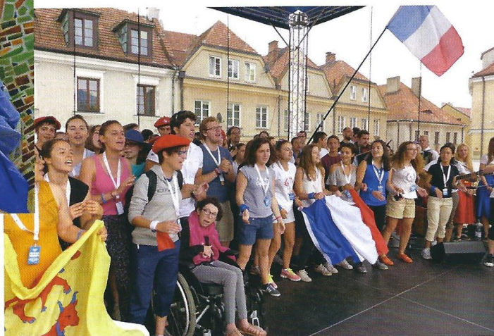
Devant plusieurs centaines de JMJistes, le groupe de notre diocèse se présente sur la scène et chante en chœur !