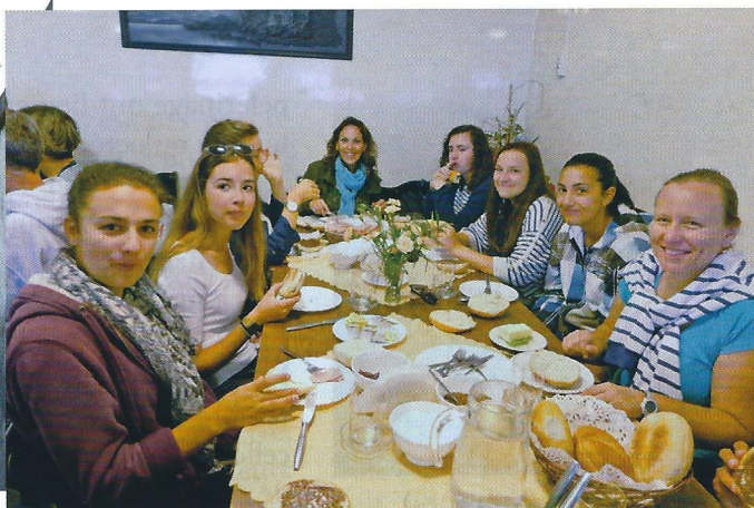
Dans les lieux qui nous accueillent, les paroisses et les familles, l'hospitalité a été extraordinaire !

18 juillet : c'est le grand départ vers la Pologne des trois bus de jeunes pèlerins du diocèse de Bayonne. À Ars-en-Formans (où a vécu le saint curé d'Ars) nous avons fait une halte spirituelle avec la messe présidée par notre évêque. Et nous voici de nouveau sur la route pour une nuit dans le bus durant la traversée de l'Allemagne, avant d'arriver en Pologne.