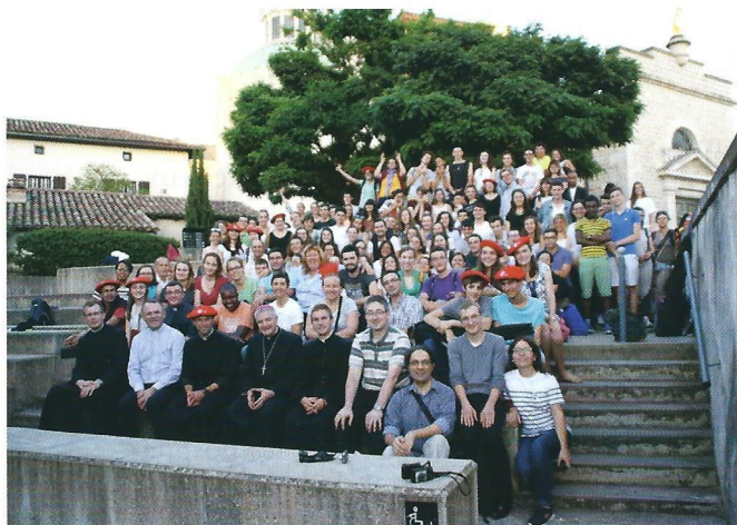
Devant la basilique d'Ars-sur-Formans.