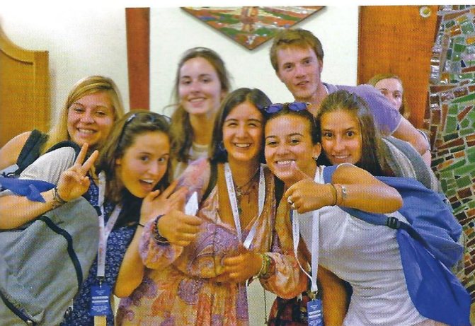
Les JMJ : au service de la joie de l'Évangile parmi les jeunes !

milles de la paroisse, puis dîner-grillades au monastère des Capucins, et un concert-spectacle sur le thème du fils prodigue.